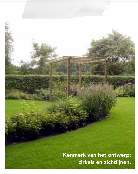
Kenmerk van het ontwerp: cirkels en zichtlijnen.

TEKST: HILLY VOORDEN DAG, PLATTEGROND, SPIERWIT/ILSE MULDER