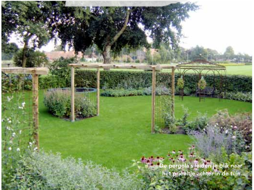
De pergola's leiden je blik naar het prieeltje achter in de tuin.

Adres: Plant & Stijl Tuinontwerp, Groningen 06 - 50 85 56 25 plantenstijl.nl